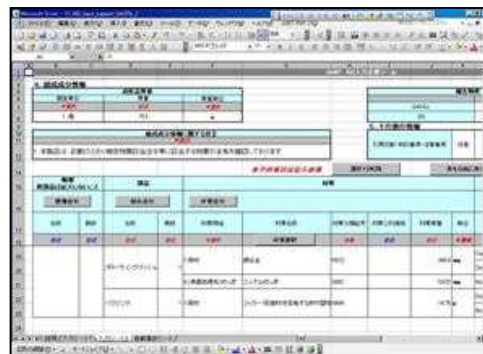
アーティクルマネジメント推進協議会(JAMP)のフォーマット